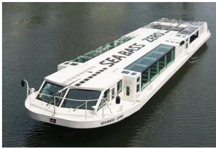
(左) シーバス ゼロ