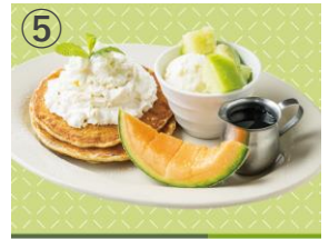
⑤ Urth Caffé 賛沢ほこたメロンのアースパンケーキ