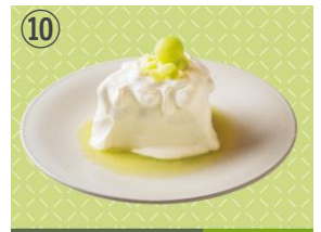
⑩ tables cook & LIVING HOUSE イバラキングのメルティショートケーキ