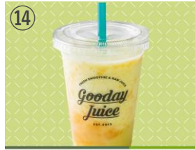
⑭ Gooday Fresh Café メロンミルクシェイク