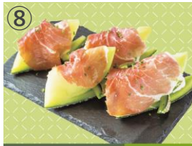
⑧ Le Bar a Vin 52 AZABU TOKYO ほこたメロンとスペイン産ハモン・セラノの「ジャンボンメロン」