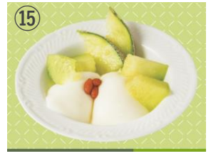
⑮ 梅蘭 ほこたメロンつき杏仁豆腐