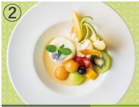
② babel bayside kitchen ほこたメロンのバナナコッタアラモード