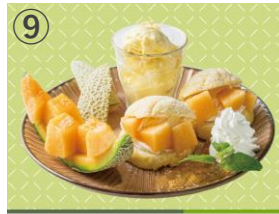
⑨ VITAL MEALS BY DADWAY ほこたメロンの賛沢メロンパンプレート