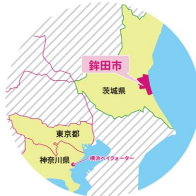
(*茨城県はメロン国内産出額第1位/2022年度農林水産省調べ)