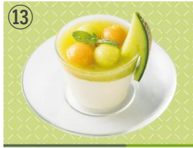
⑬ CHUTNEY ほこたメロンソースの杏仁豆腐