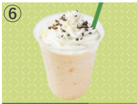
⑥ 横浜梅や CHICKEN EVERYDAY ヨーグルトメロンスムージー