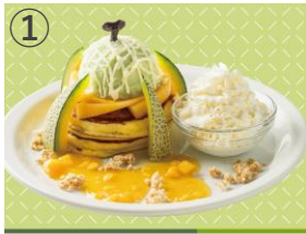
① Butter ほこたメロンとカスタードのパンケーキ