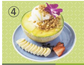
④ ISLAND VINTAGE COFFEE ほこたメロンヨーグルトボウル