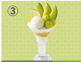
③ niko and ... KITCHEN ほこたメロンパフェ