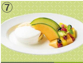
⑦ BUTTERMILK CHANNEL バターミルクパンケーキ ヨーグルトソース