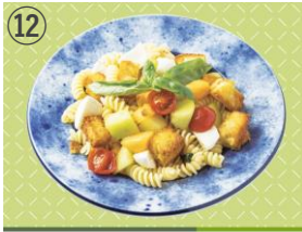
⑫ MAR-DE NAPOLI ほこたメロンのパンツァネッラ風冷たいフジッリ