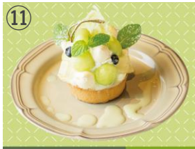
⑪ ビストロ リュバン 完熟イバラキングのボンボンタルト