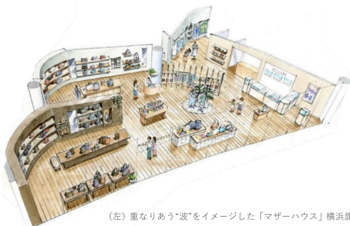
（左）重なりあう“波”をイメージした「マザーハウス」横浜旗艦店

3月10日（木）にリニューアルオープンするのは、横浜ベイクォーターで出店10周年を迎える「マザーハウス」。従来の店舗から売場面積を2倍に拡張し、横浜エリアの旗艦店として新たなスタートを切ります。ブランドを代表するアイテムであるレザーやジュート（麻の一種）のバッグのほか、アパレルライン「E.（イードット）」、ジュエリー、食のブランド「リトルマザーハウス」のチョコレートまで、同社がつくる全てのラインが揃います。